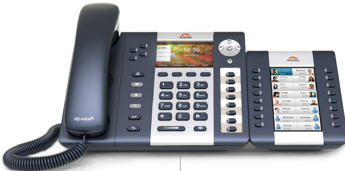
Модуль расширения Platan EXT-244CG с телефоном Platan IP-T216CG.